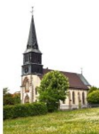
Kirche St. Vitus und St Anna

Im Jahr 2010 wurde die Sakristei umfassend renoviert und erweitert – inklusive einer barrierefreien Toilette für Kirchenbesucher. Ebenfalls 2010 wurde auf dem Gelände der St.-Vitus-Brunnen angelegt, der die spirituelle Atmosphäre rund um die Kirche abrundet.